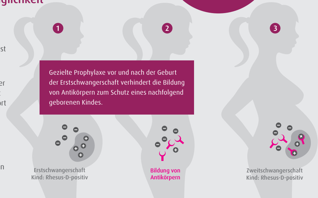
Erstschwangerschaft Kind: Rhesus-D-positiv